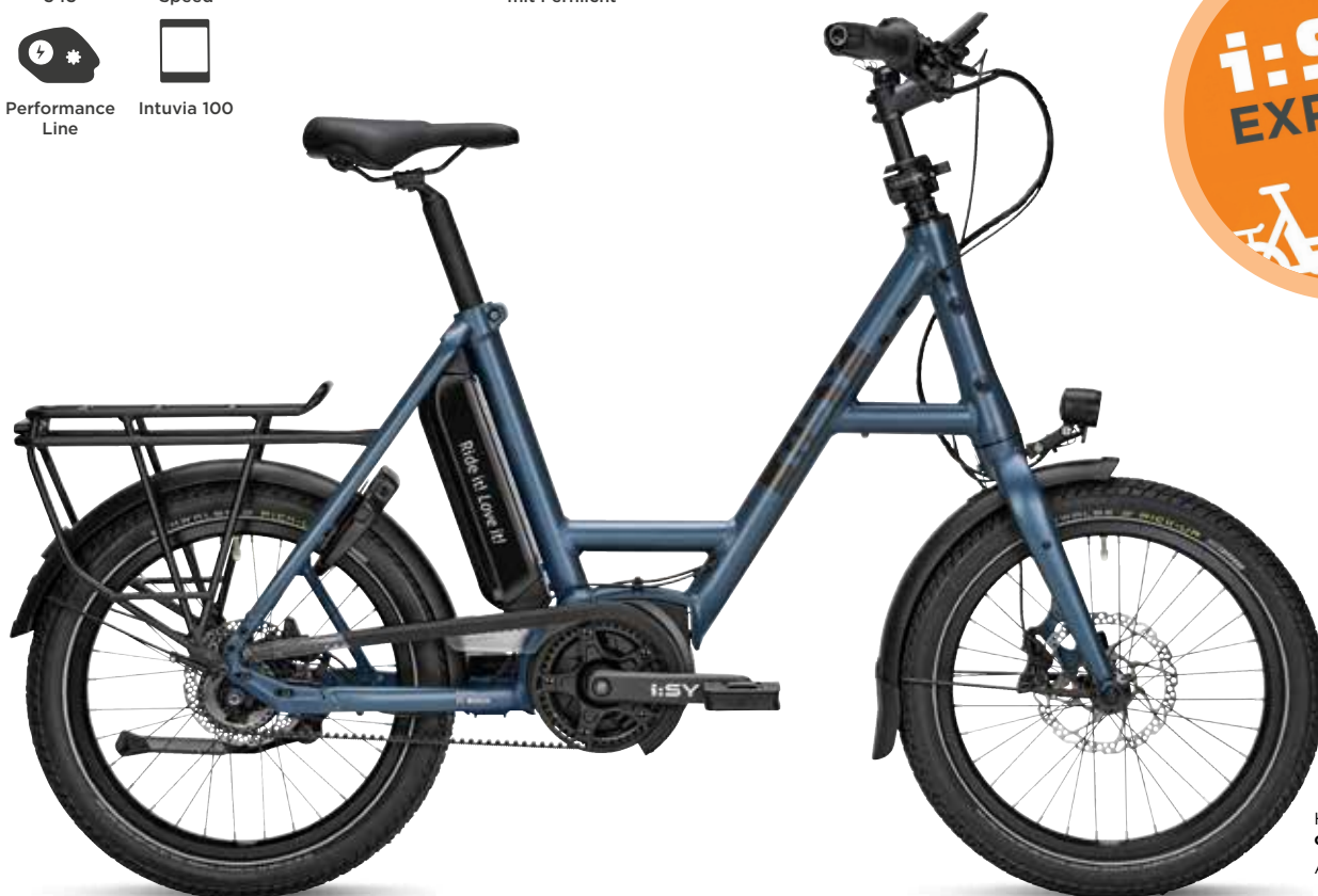
Hier abgebildet: cosmos blue matt Abbildung ähnlich